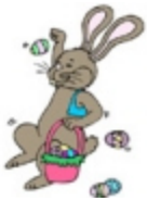
an Easter Bunny