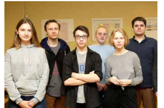
Волонтеры полиграфистов.