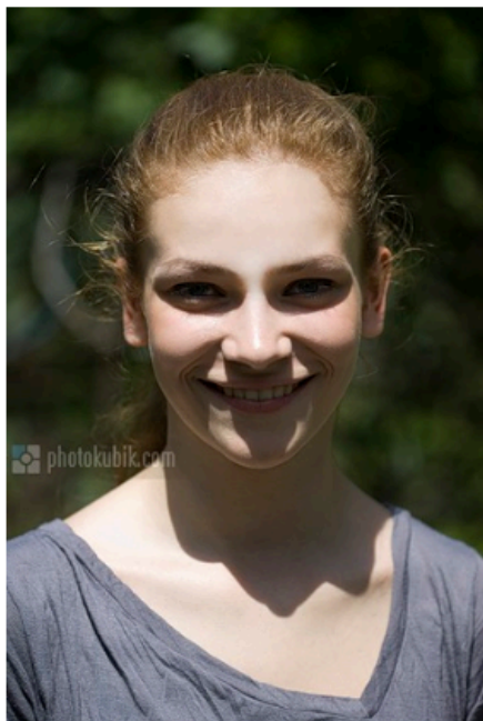
без использования отражателя при фронтальном солнечном освещении