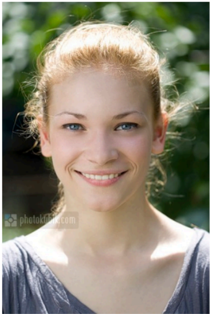
белый отражатель расположен сверху-слева под углом 45 градусов относительно модели, снято в контрольном солнечном освещении