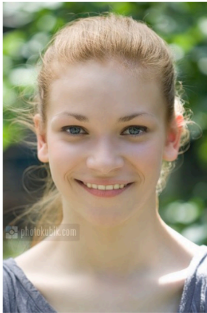
отражатель «на просвет» расположен фронтально над головой модели, снято в контрольном солнечном освещении

Используйте окружающие предметы, как естественные затенители и ограничители светового потока солнечного света, например кроны деревьев. Также светлые стены, близко расположенных построек, могут сыграть роль естественных отражательных поверхностей.