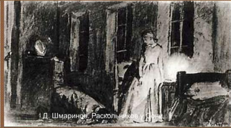
Д. Шмаринов. Раскольников и Соня.