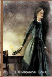
Д. Шмаринов. Соня.

«...если бы вдруг всё это на ваше решение отдали: тому или тем жить на свете, то есть Лужину ли жить и делать мерзости, или умереть Катерине Ивановне? То как бы вы решили: кому из них умереть?»