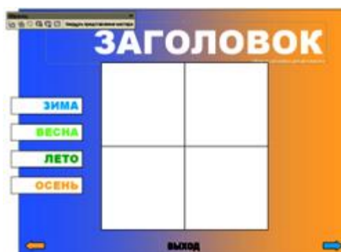
Рис.7. Образец слайдов