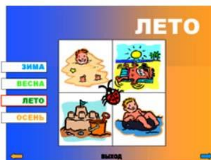
Рис.4. Слайд 4.