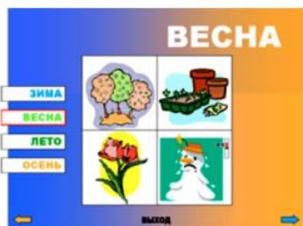
Рис.3. Слайд 3.