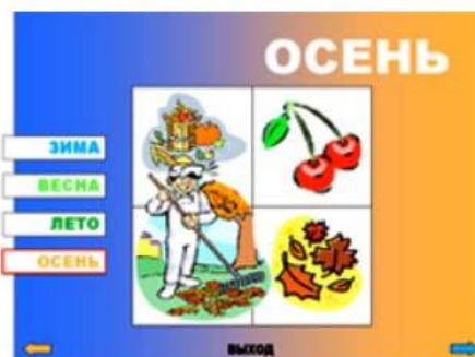
Рис.5. Слайд 5.